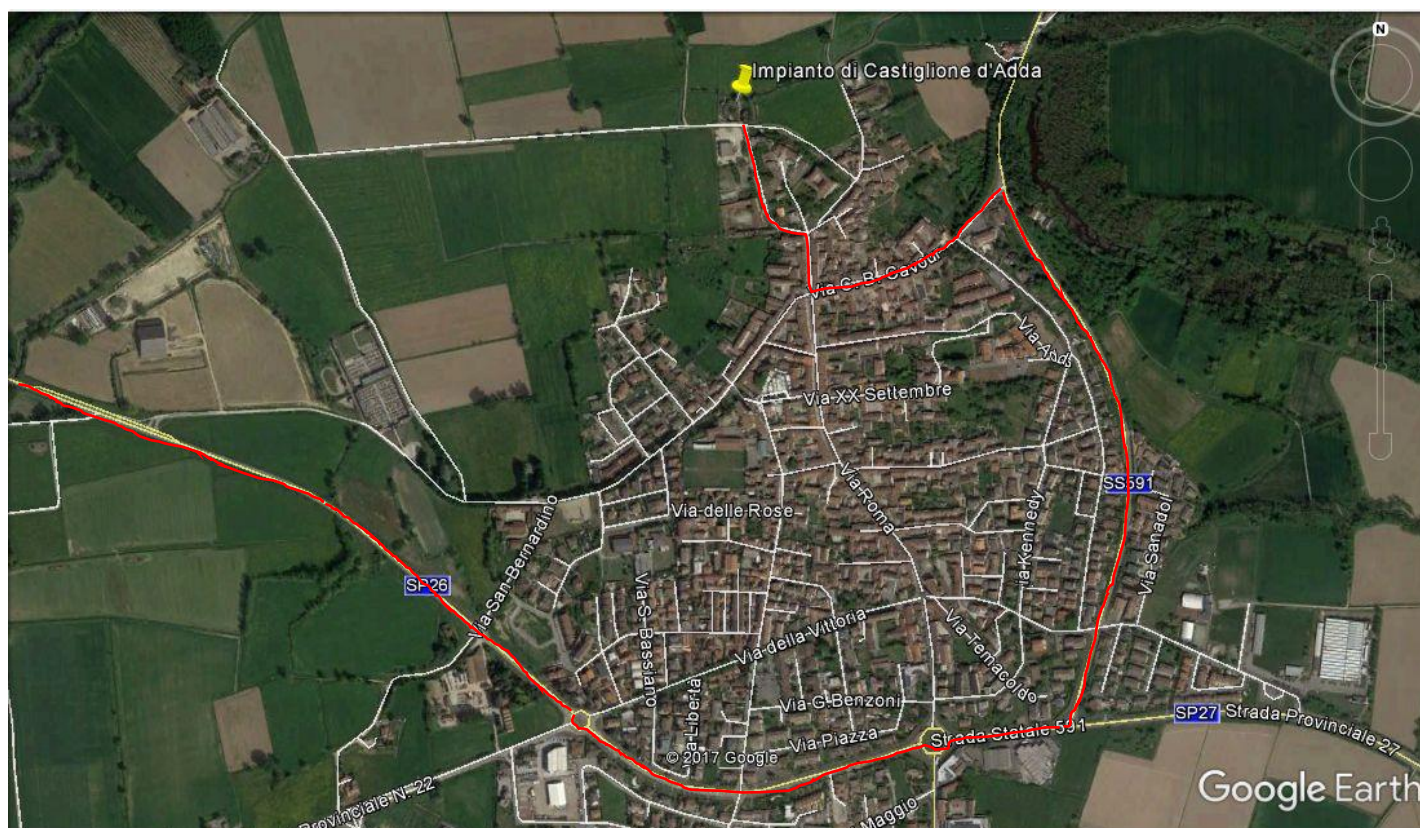
Figura: percorso di accesso al cantiere

I mezzi di cantiere accederanno al depuratore seguendo la viabilità riportata nella figura seguente, percorrendo l'ultimo tratto di via Vallone del Mulino da Sud prima di arrivare all'impianto.